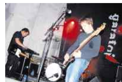
Eat your Toys.

Enfin, on attend de pied ferme ceux qui joueront sans doute les têtes d'affiche de la Nuit Sonique : les French Cowboy, quatre anciens Little Rabbits. Trois albums au compteur et des tas de concerts avec Philippe