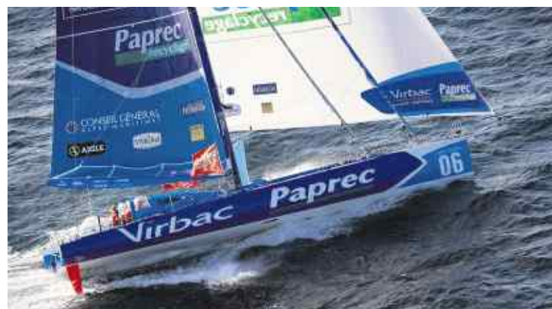
Virbac-Paprec 3 , tout neuf.