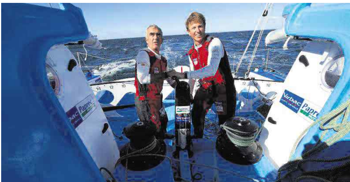
Loïck Peyron et Jean-Pierre Dick à l'entraînement à bord de Virbac-Paprec 3 .

Tandem de choc Jean-Pierre Dick, 45 ans, et Loïck Peyron, le Baulois, 51 ans, se connaissent bien. Ensemble, ils ont remporté la transat en double, la